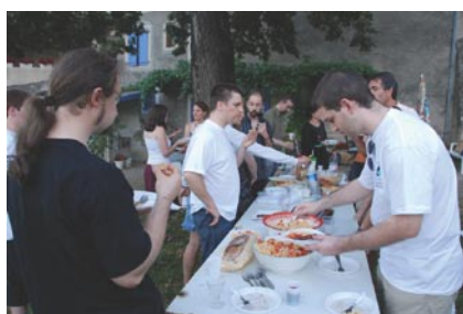
↑ Malgré le programme chargé et l'ambiance studieuse, Ultimate Z avait un petit air de vacances.