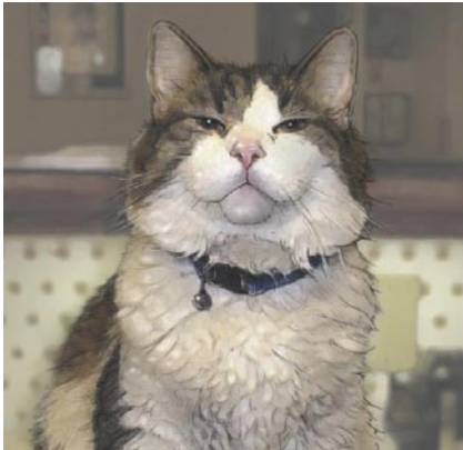
↑ Oscar a-t-il réellement un « sixième sens » pour pressentir la mort ?