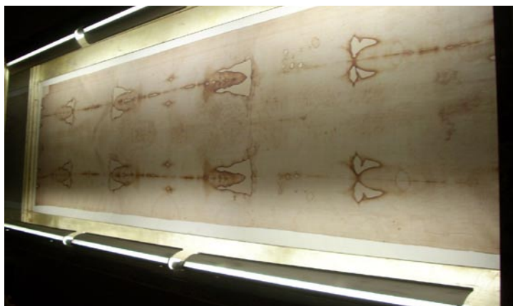
L'Institut pontifical Notre-Dame de Jérusalem expose une reproduction du linceul : un drap rectangulaire impressionnant de 4,36 m sur 1,10 m.

L'objectif du travail de Fesenko est de montrer que le suaire a pu être créé à une date proche de l'an 0, donc que t_3 est l'an 0, en tenant compte du fait qu'à la date t_2 , suite à l'incendie, de l'huile servant à nettoyer son cadre fut malencontreusement projetée sur le lin. Il introduit pour cela la grandeur k , pourcentage d'atomes de carbone 14 rajoutés dans cet accident par rapport à la quantité d'atomes de carbone 14 présents lors de la fabrication du linge. Ainsi, si k = 0 , alors t_3 = 0 . Comprenez : si rien n'a été ajouté en 1532, la radiodation donnera un suaire datant de l'an 0.