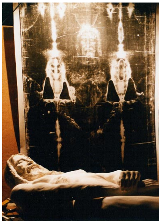
Le « suaire de Turin », que l'on devrait plus justement appeler « linceul de Turin », est une relique conservée dans la chapelle royale de la cathédrale Saint-Jean-Baptiste de Turin en Italie. Ce drap de lin présente l'image d'un corps crucifié ; certains pensent qu'il s'agit de celui de Jésus Christ.

Comme j'ai quelques notions de russe et comme les traducteurs automatiques ne sont pas trop mauvais lorsqu'il s'agit de traduire vers l'anglais, j'ai pu aller au