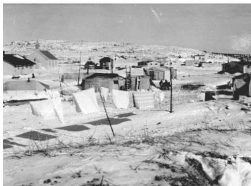
Les habitants du village d'Angikuni ont-ils réellement tous disparus, laissant à l'abandon leurs maisons ? Ont-ils été enlevés par des extra-terrestres ?

Le mystère d'Anjikuni commença quand un trappeur, Joseph Labelle arriva dans la colonie au bord du lac à la fin de l'hiver 1930 : « Dès que je suis rentré dans la petite ville, j'ai été rempli de crainte et d'appréhension : rien n'allait... » Labelle commença à avoir des frissons glacés et ce n'était pas à cause de la température inférieure à zéro degré. « J'ai couru d'igloo en igloo, frappant à chaque porte, recherchant le plus petit signe de vie. Mais il n'y avait rien », dit Labelle toujours secoué par ces souvenirs. « J'ai senti tout de suite que quelque chose n'allait pas... - Au vu des plats à moitié cuisinés, j'ai su qu'ils avaient été dérangés pendant la préparation du dîner. Dans chaque cabane, j'ai trouvé un fusil appuyé à côté de la porte - et aucun esquimau ne va nulle part sans son fusil ». Avec horreur, Labelle va découvrir tous les chiens morts, attachés aux arbres. Tout près, dans le cimetière, la terre gelée et dure avait été retournée et les corps enlevés. « J'ai compris